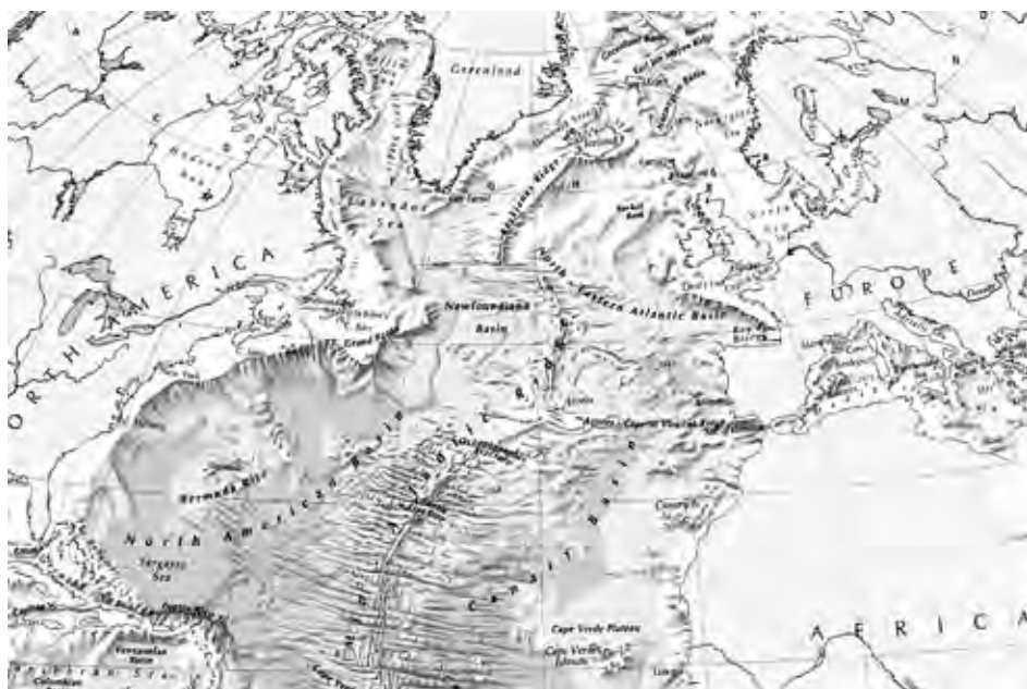
Rys. 3. Grzbiet Śródatlantycki stanowi centrum trzęsień ziemi i erupcji wulkanów, występujących na obszarze Oceanu Atlantyckiego, gdzie Platon najprawdopodobniej umiejscowił Atlantyde.