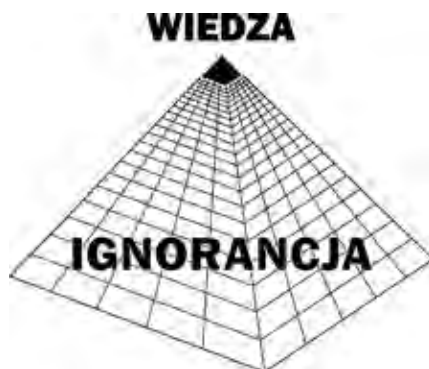
Rys. 1. Wiedza pozostaje w rękach niewielu, a reszta ludzi tkwi w ignorancji. Jest to klasyczna struktura manipulacji i kontroli.

Masy są tłamszone i kierowane przez wiele rozmaitych form umysłowej i emocjonalnej kontroli. To jedyne sposoby, w jaki można tego dokonać. Niewielka grupa nie może kontrolować fizycznie miliardów, tak jak zwierzęta na farmie nie mogą być dogłądane, o ile nie bierze w tym udziału duża liczba ludzi. Chociaż kiedyś dwie świny uciekły z rzeźni w Anglii i pomimo wysiłku wielu osób, tak długo unikały schwytania, że stały się narodowymi sławami. Fizyczna kontrola globalnej populacji nie może zadziałać, ale nie jest też konieczna, kiedy można zmanipulować sposób myślenia ludzi i ich odczuwania do takiego stopnia, że „decydują” zrobić dokładnie to, czego od nich chcesz, i żądają,